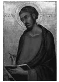
Lucas, de evangelist.

vige aardbevingen zijn, en hongersnood en pest, nu hier dan daar, schrikwekkende dingen en aan de hemel geweldige tekenen. Maar nog vóór dit alles geschiedt, zullen zij u vastgrijpen en vervolgen; zij zullen u overleveren aan de synagogen en gevangen zetten, u voor koningen en stadhouders voeren omwille van mijn Naam. Het zal voor u uitlopen op het geven van getuigenis. Welnu, prent het u in, dat gij dan uw verdediging niet moet voorbereiden. Want Ik zal u een taal en een wijsheid geven, die geen van uw tegenstanders zal kunnen weerstaan of weerspreken. Ge zult zelfs door ouders en broers, door bloedverwanten en vrienden overgeleverd worden en sommigen van u zullen ze ter dood doen brengen. Ge zult een voorwerp van haat zijn voor allen omwille van mijn Naam: geen haar van uw hoofd zal verloren gaan. Door standvastig te zijn zult ge uw leven winnen.