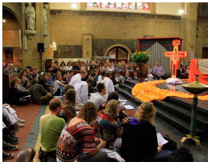
Taizekickoff 101003, Foto: Jan Heijboer.