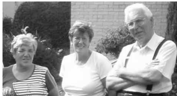
De bestuursleden van Irmão Sol/Broeder Zon