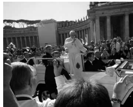
Audiëntie op het Sint Pietersplein.

Vermoeid, maar met een schat aan herinneringen kwamen onze vier dorpsgenoten weer in Wassenaar aan.